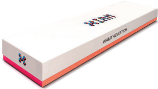
IAM-BOX01 (incluso nell'ordine)